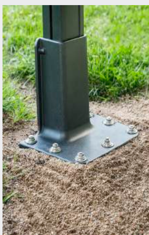
Fästplatta på gjuten plint.